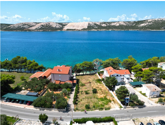
Drohnenaufnahme Blick auf das Meer